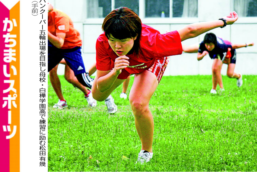
かちまいスポーツ