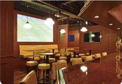
大型スクリーンでスポーツ観戦ができ、ダーツも完備しています!

ノーチャージ ●宴会120分飲み放題 ..... 3,000円 ※40~50名応相談 ●結婚式120分飲み放題(オードブル付き) ..... 3,500円 +500円ピンチョス立食60名以上応相談 シャンパンタワー+500円、出席リスト作成、 案内状、ウエルカムボード作成、 写真撮影、120インチプロジェクター完備 お荷物預かり、飾り付け可能(事前相談) 新郎新婦無料