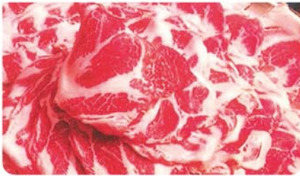
希少ブランドにつき、入荷状況によって十分なご提供ができない場合がございます

☎0155-29-2975 帯広市西1条南8丁目20-1 たいやき工房広小路店内 営:ランチ11時30分~14時 ※コースは完全予約制のため時間・曜日応相談 子 ラ 貸 T