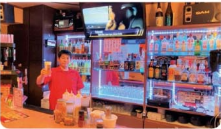
イエーガーショットとたこ焼きのコラボがイチオシ!!

☎090-2878-9115 帯広市西2条南11丁目 猫天ビル3F 営:20時~翌5時(金・土曜~LAST、日曜~翌3時) 休:なし カ 貸 タ T 22