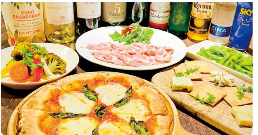
1.5次会貸切プランのフード5品はピザ(マルゲリータorチーズorスパイシー牛肉と軟白ネギ)・枝豆・黒糖ペッパーポーク・チーズ盛り合わせ・自家製ピクルスです!