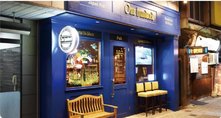
広々とした大人カジュアルな空間でおいしいお酒と、さまざまな人との出会いが楽しめるブリティッシュパブ