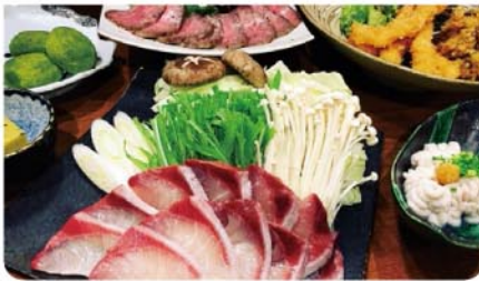
料理の内容はお気軽にご相談を! 写真は3,500円コース

☎0155-67-4556 帯広市西17条南3丁目1(白樺ドリームタウン西向い) 営:11時~LAST 休:なし P:25台 個 子 ラ 貸 T 7