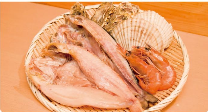
こだわりの自家製干物をふっくら香ばしく焼き上げます