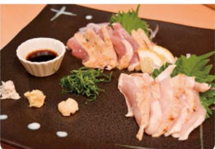
(新得地鶏のたたき)もおすすり

☎0155-67-1848 帯広市西2条南11丁目8-2 747館1F(北側) 営:17時~LAST 休:日曜