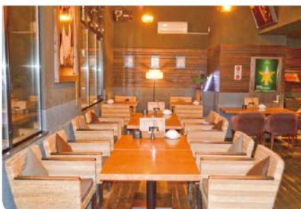
ウイルス対策でグリーンリフレ(電解無塩型次亜塩素酸水)空間噴霧中

①1.5次会貸切プラン (3日前まで要予約) 13~40名様まで 1人 4,000円(税込) 120分飲み放題(生ビール込)+フード5品+カラオケ歌い放題 ★フード5品 ピザ(マルゲリータorチーズorスパイシー牛肉と軟白ネギ)・枝豆・黒糖ペッパーポーク・チーズ盛り合わせ・自家製ピクルス ②2次会貸切プラン (要予約) 15~50名様 1人 3,000円(税込) 120分飲み放題(生ビール込)+おつまみ2品+カラオケ歌い放題 ★おつまみ2品 枝豆・黒糖ペッパーポーク ※オープン時間の調整や人数などその他もろもろ お気軽にご相談ください。