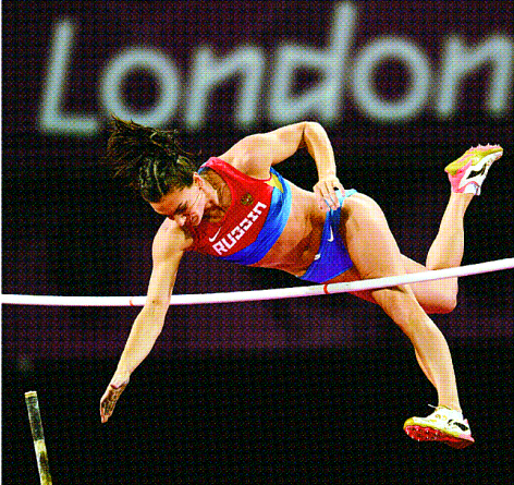
女子棒高跳び3連覇ならず