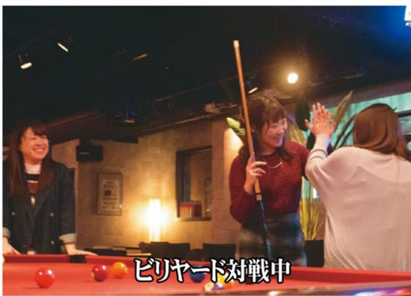
ビリヤード対戦中