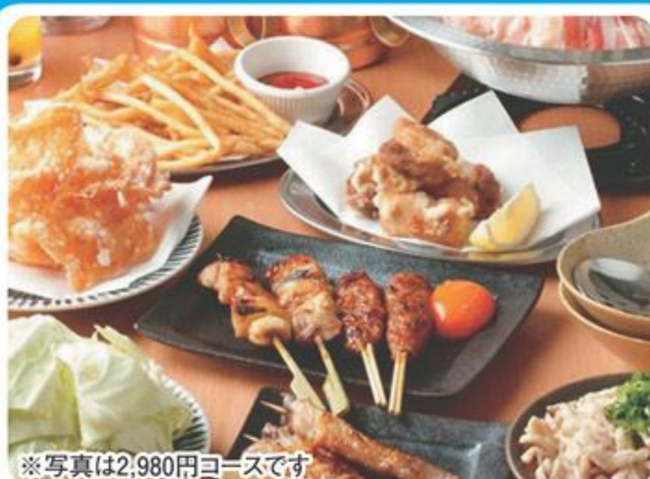
※写真は2,980円コースです

2名様～・120分飲み放題付き 2,980円(税別)・3,480円(税込) 20時30分以降の宴会ご予約特典 ▼通常120分を▼ 150分に延長サービス!!