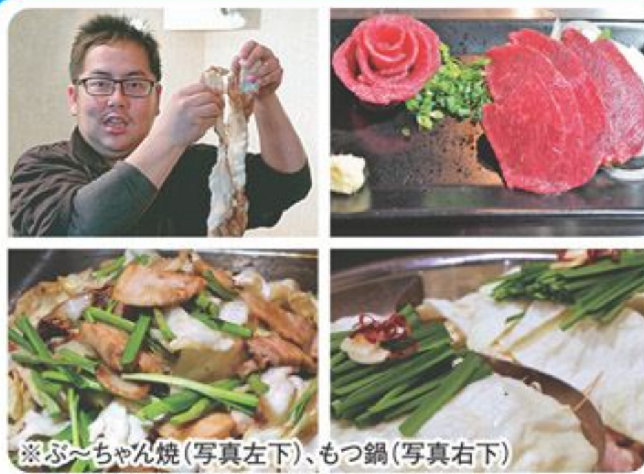
※ぶ〜ちゃん焼(写真左下)、もつ鍋(写真右下)

★宴会プラン 4名様～ (2時間飲み放題付き) 内容は応相談 4,000円～5,500円 「楽宴見た」で グループ全員500円OFF!